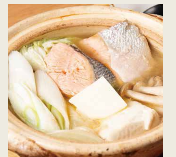
鮭と野菜の 味噌バター鍋 1260 (税込1386円)