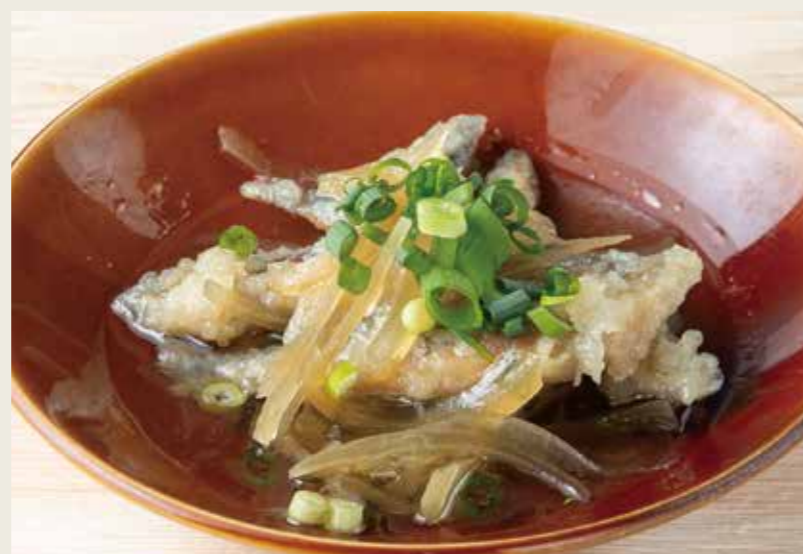
きびなご南蛮漬 580 (税込638円)