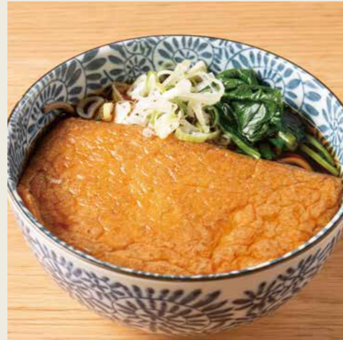
きつねそば (温/冷) 750円 税込