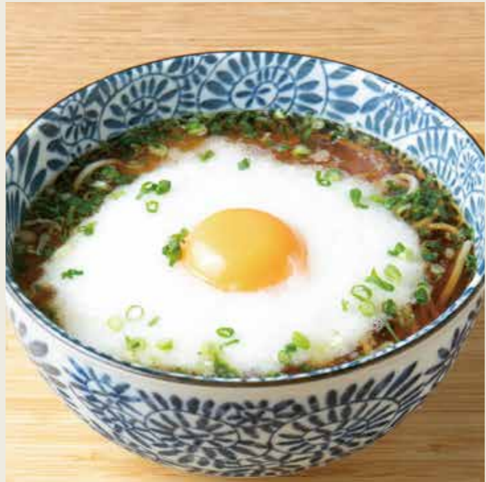
月見とろろそば (温/冷) 880円 税込