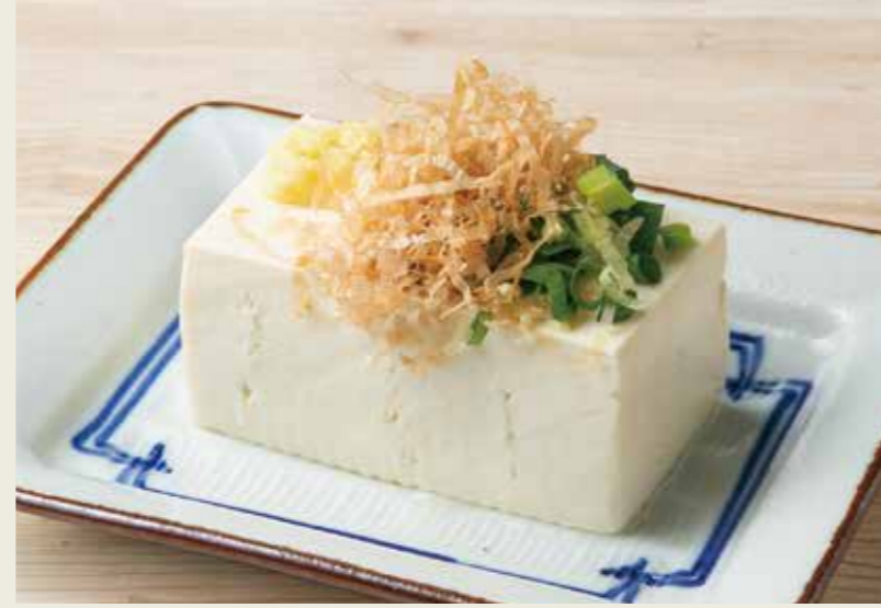
冷奴 320 (税込352円)