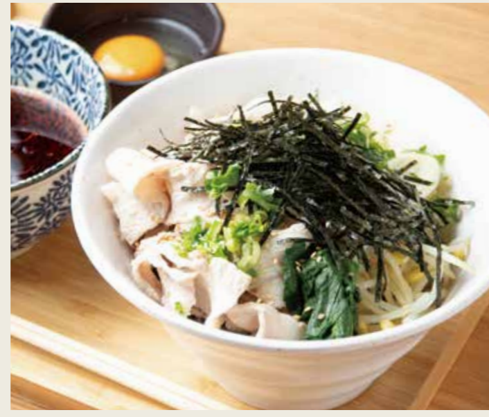
肉野菜つけ蕎麦 1000円 税込