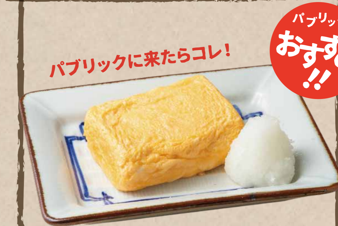
だし巻き玉子 480 (税込528円)