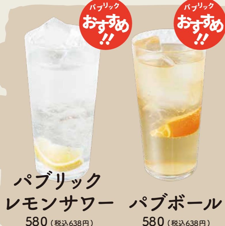
パブリック レモンサワー 580 (税込638円) パブボール 580 (税込638円)

生ビール・瓶ビール 焼酎・日本酒・梅酒 果実酒・ウイスキー ソフトドリンクも! お好きなもので みんなで乾杯!