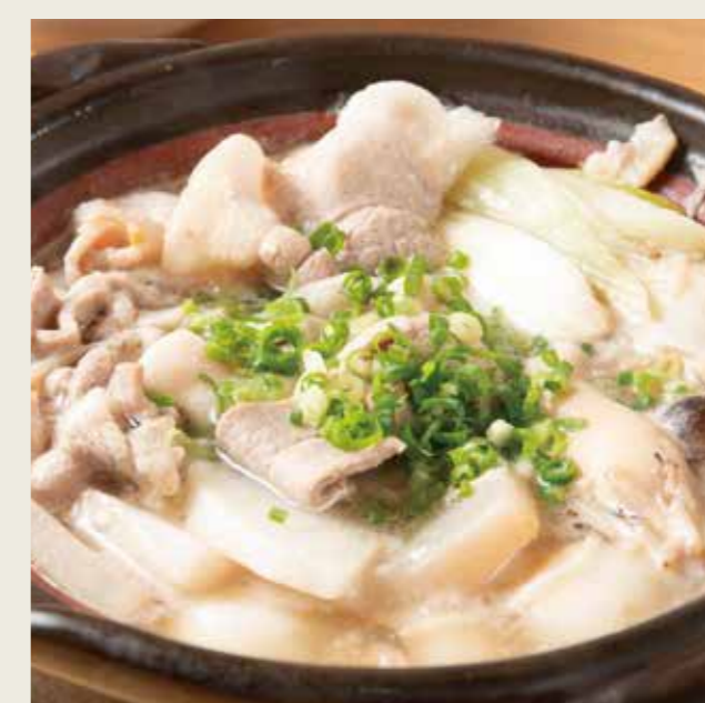
芋煮風味噌鍋 1160 (税込1276円)