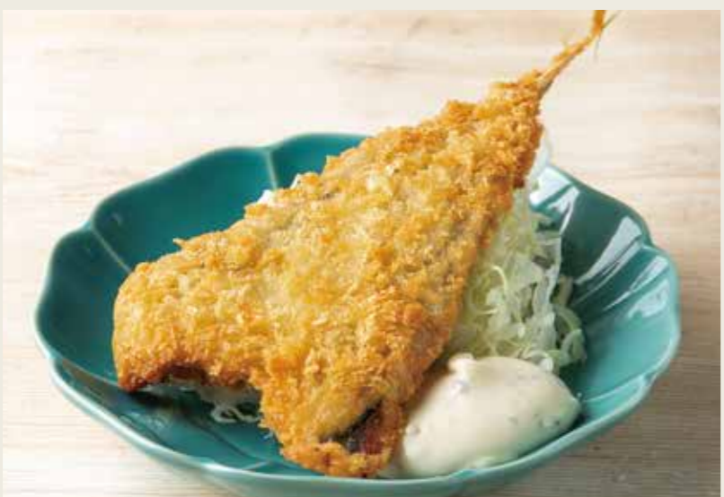
アジフライ 430 (税込473円)