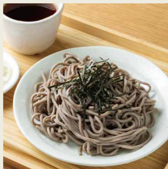
もりそば (冷) 650円 税込