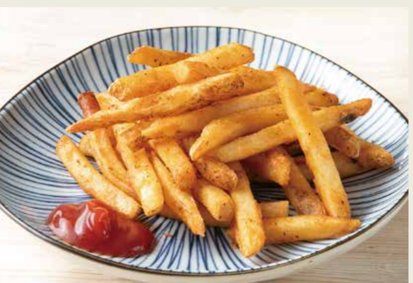
ポテトフライ 480 (税込528円)