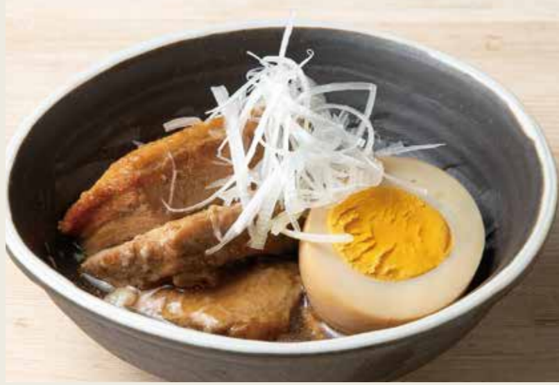
豚角煮 580 (税込638円)