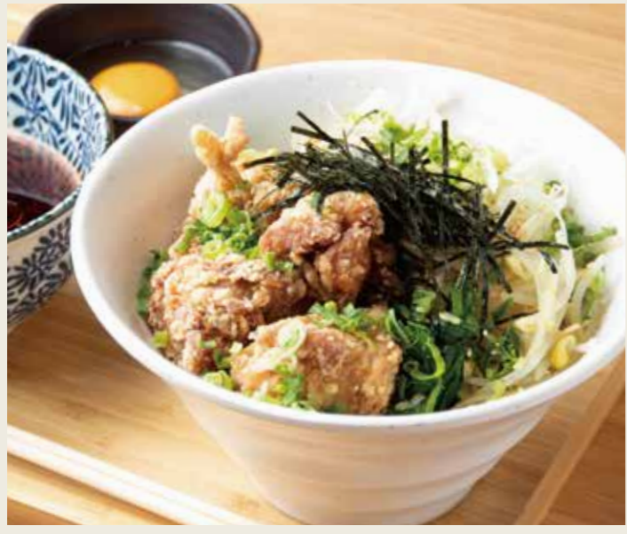
唐揚げつけ蕎麦 1000円 税込