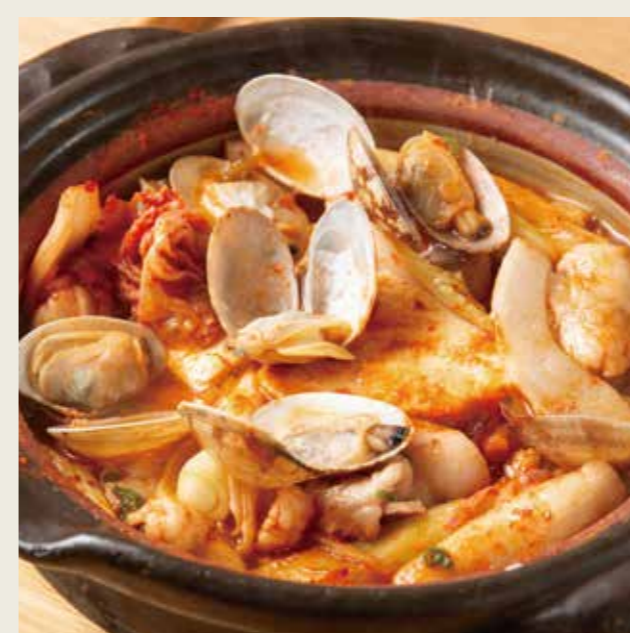
アサリと豚肉の スンドゥブ風 キムチ鍋 1280 (税込1408円)