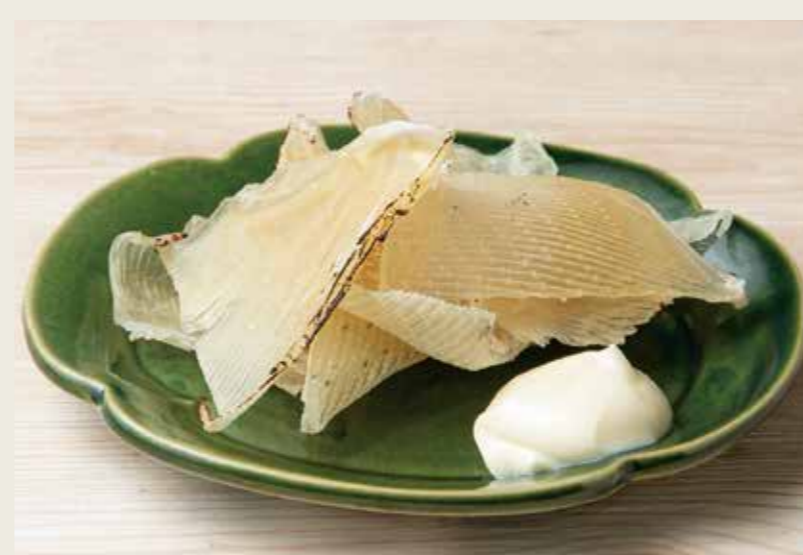
炙りエイヒレ 650 (税込715円)