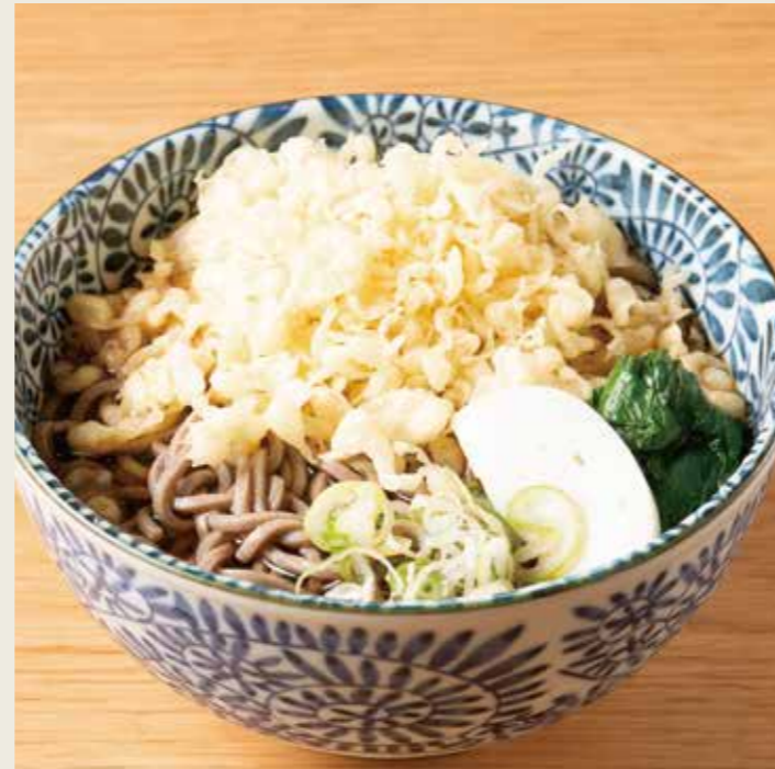
たぬきそば (温/冷) 680円 税込