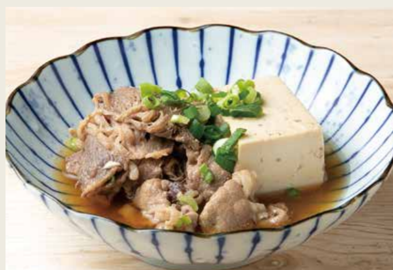
肉豆腐 620 (税込682円)