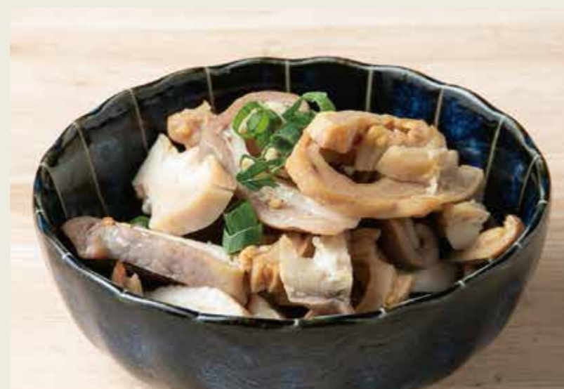
がっポン酢 480 (税込528円)