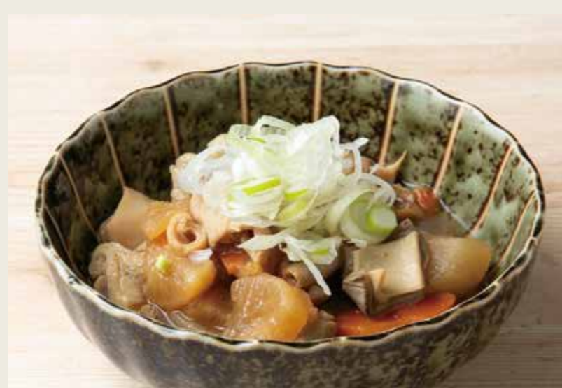
もつ煮込み 480 (税込528円)