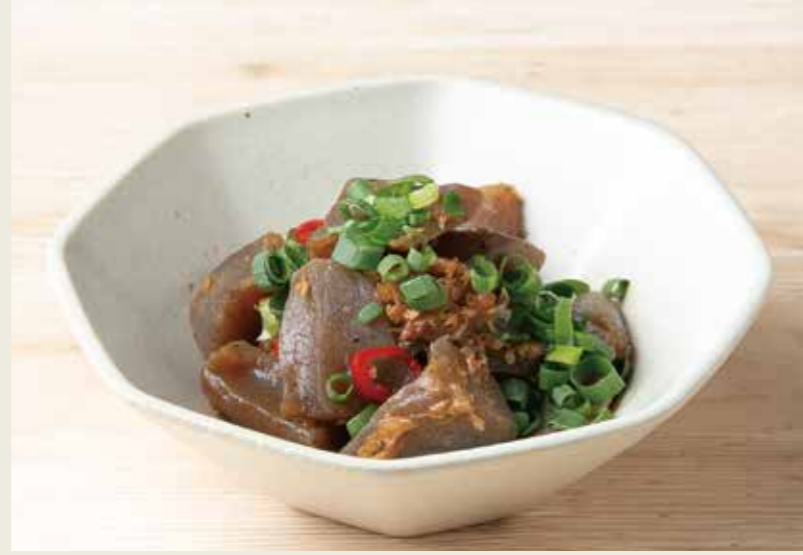
こんにゃくピリ辛煮 380 (税込418円)