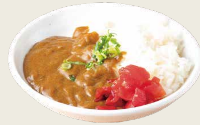
ミニカレー +300円 税込