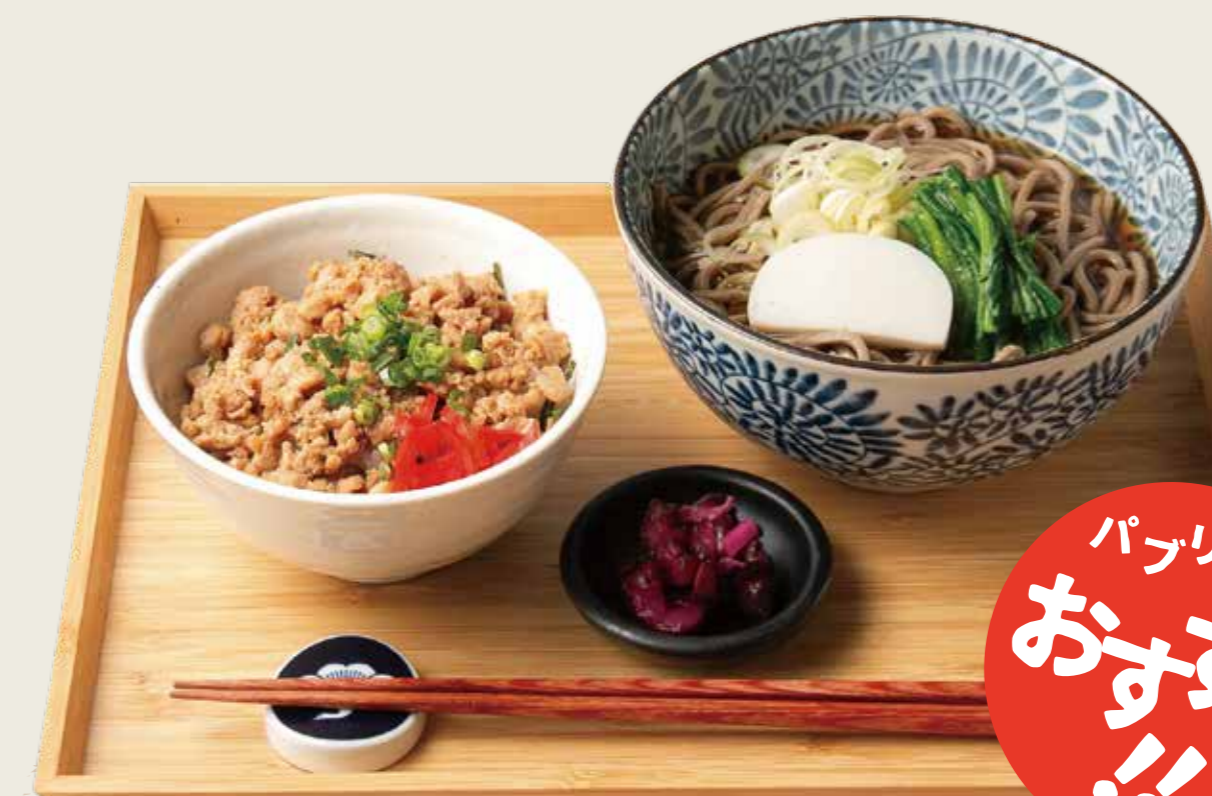
そば+ミニ丼セット 950円 税込