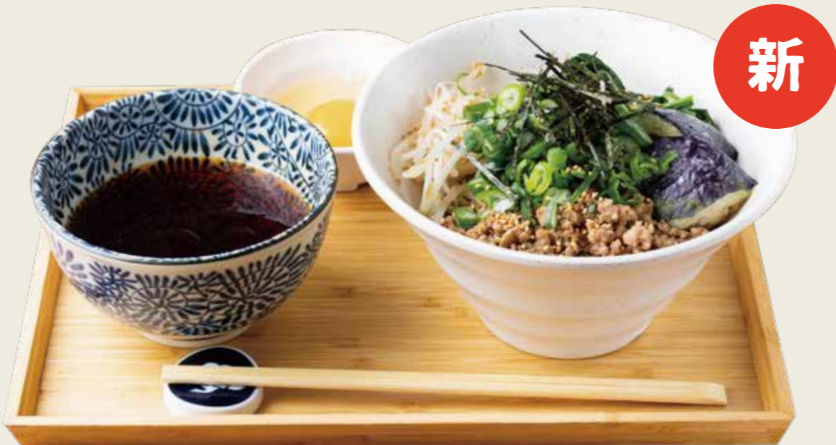
鴨そぼろ九条ネギつけ蕎麦 1200円 税込