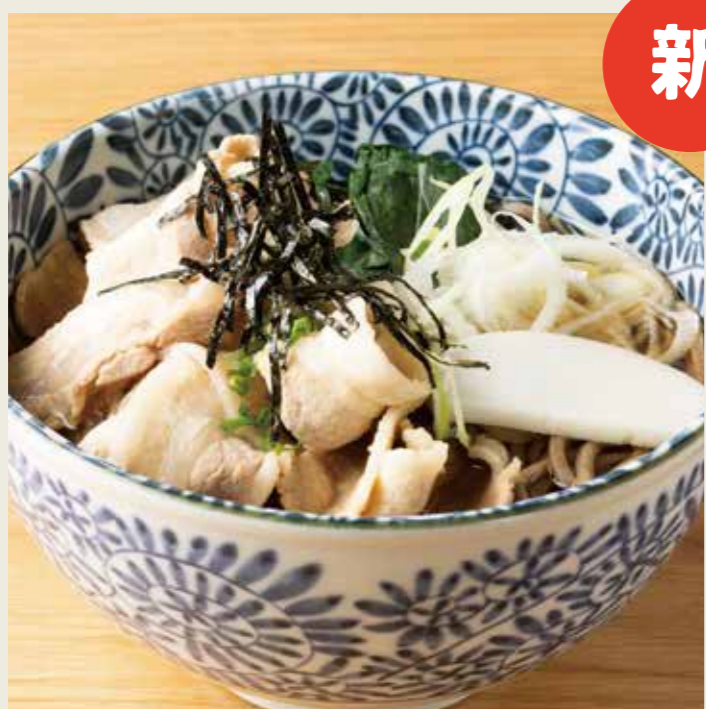
肉そば (温/冷) 880円 税込