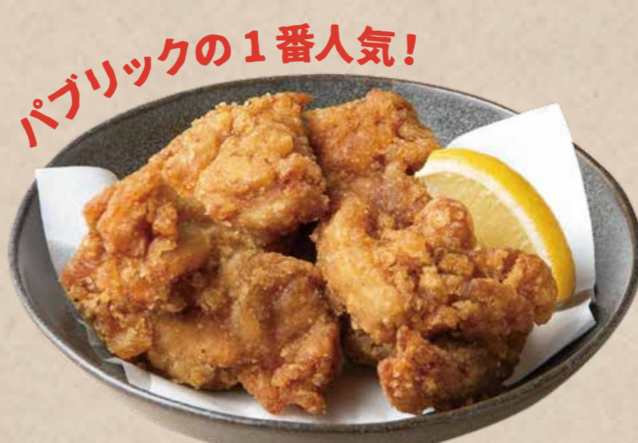
鶏の唐揚げ 580 (税込638円)