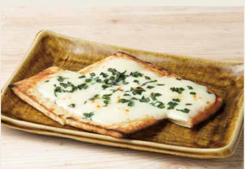
チーズピザ 480 (税込528円)