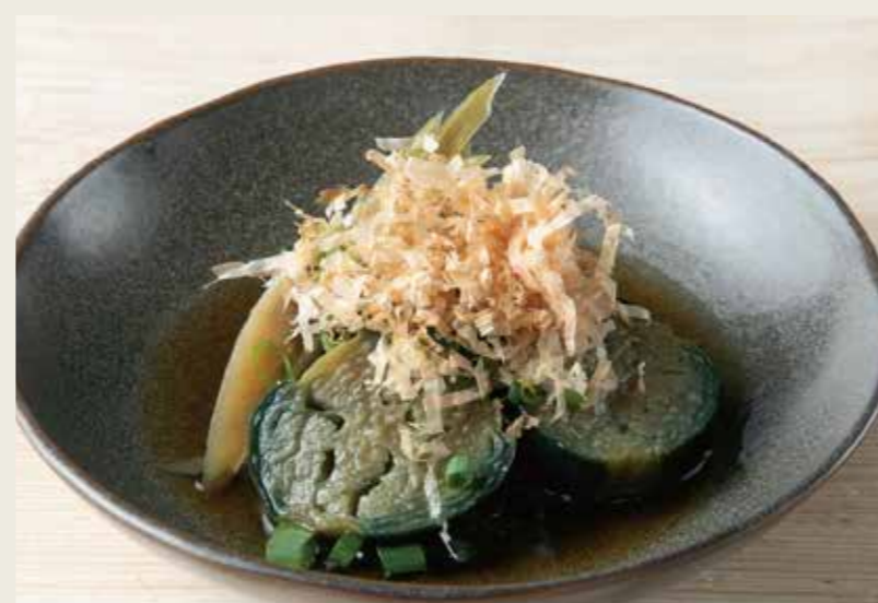
茄子揚げびたし 450 (税込495円)