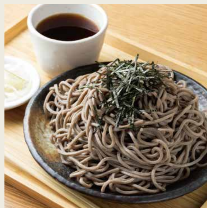
特盛そば (冷) 850円 税込