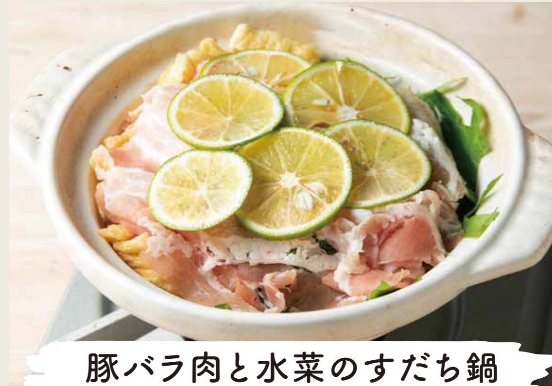
豚バラ肉と水菜のすだち鍋 1080 (税込1188円)

生ビール・瓶ビール 焼酎・日本酒・梅酒 果実酒・ウイスキー ソフトドリンクも! お好きなもので みんなで乾杯!